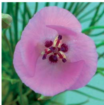
Calochortus 'Violet Queen'

In deze publicatie geven we meestal aan of een cultivar kwekersrechtelijk beschermd is op basis van het Nederlandse of Europese kwekersrecht. U dient zelf na te gaan bij de desbetreffende kwekersrechterautoriteiten wat de laatste stand van zaken is. Verder wijzen wij u erop dat er kwekersrecht of plantpatent verleend kan zijn in andere landen. Ook merkrecht kan van land tot land verschillen. De KAVB en/of BloembollenVisie zijn niet aansprakelijk voor schade voortvloeiend uit de registratie en/of publicatie van de desbetreffende cultivars.