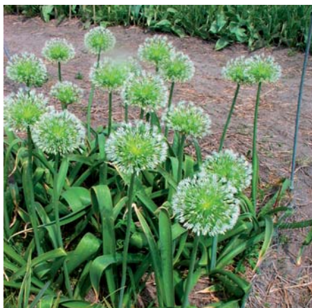
Allium jesdianum 'White Empress'