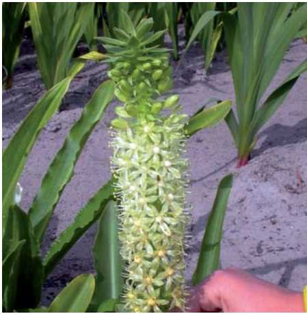
Eucomis comosa 'Tugela Jade'