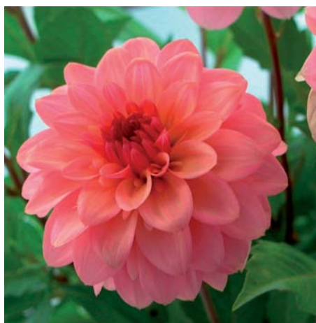
Dahlia ' Ragazza '

Dahlia ' Purple Explosion ' (Decoratieve Groep) Edibulbcode: 78502 Mutant van: 'Explosion' Registrant: F. van der Vlugt, Hillegom. Samenvatting: paars 61A met witte 155C strepen. Winner: F. van der Vlugt, Hillegom. Getuigschrift Proeftuin 2007