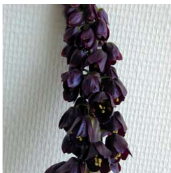
Fritillaria persica 'Purple Dynamite'