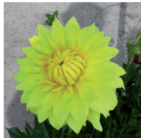
Dahlia ' Yellow Passions '

Dahlia ' Wizard of Oz ' (Bal Groep) Edibulbcode: 76334 Registrant: J. van der Linden & Zonen B.V., Hillegom. Samenvatting: licht blauwrose 73C met vage licht blauwrose 73D strepen. Winner: Leo Berbee. Getuigschrift Proeftuin 2007