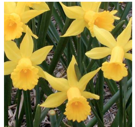
Narcissus 'Tweety Bird'

Narcissus 'Toyama' (Dubbele Groep), 4 Y-Y Edibulbcode: 79162 Mutant van: 'White Marvel' Registrant: Fa. Chr. van der Salm & Zn., Lisse. Samenvatting: geel 5B en geelgroen 4C. Winner: C.P.C. van der Salm.