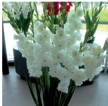
Gladiolus 'White Heaven'

Gladiolus 'Waris' (Kleinbloemige Groep) Edibulbcode: 79084 NAGC code: 386 Registrant: Fa. Exclusief, Balkbrug. Samenvatting: zwart N186B met donkerviolet 83A. Winner: J. Snoek. Getuigschrift Proeftuin 2005