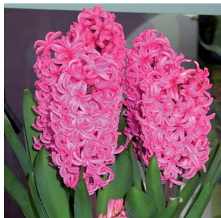
Hyacinthus orientalis 'Johanna'