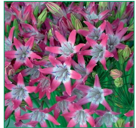
Triteleia 'Power Point'

Triteleia 'Power Point' , TTL 24 Edibulbcode: 82171 Registrant: Royal Blue B.V., Breezand. Samenvatting: blauwrose N74C met wit 155D aan basis.