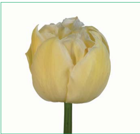
Tulipa 'Rosebery' (Dubbele Vroege Groep)

Tulipa 'Rosalie Claire' (Gefranjerde Groep) Edibulbcode: 82271 Registrant: Tulpenselectie.nl, Enkhuizen. Samenvatting: paars 58A, wit 155A gerand. Winner: Douwe Wierstra B.V., Andijk.