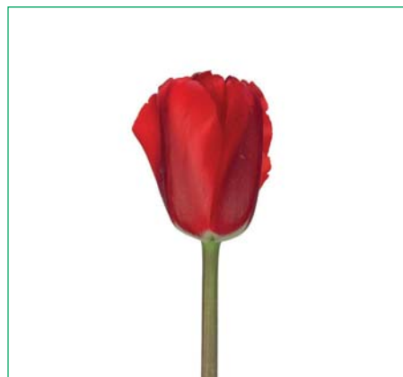
Tulipa 'Red Balance' (Triumf Groep)

Tulipa 'Rasteau' (Triumf Groep) Edibulbcode: 82260 Registrant: Triflor B.V., Nieuwe Niedorp. Samenvatting: paarsrood 60B, paars 60C gerand. Winner: INRA, Frankrijk.