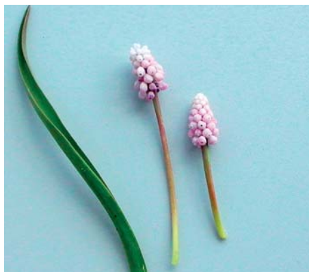
Muscari 'Pink Sunrise'