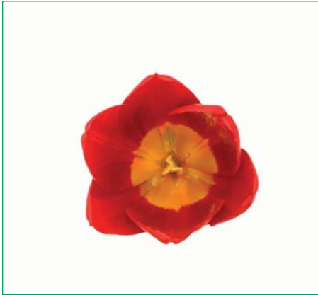
Tulipa 'Rodeo Drive'

Tulipa 'Roly' (Triumf Groep), TLP 1936 Edibulbcode: 76716 Mutant van: 'Lydia' Registrant: Hybris B.V., Lisse. Samenvatting: rood 50A Winner: Hybris B.V., Lisse.