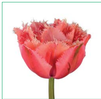
Tulipa 'Pink Magic'