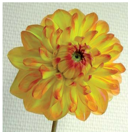
Dahlia 'Happy Go Lucky'

Dahlia 'Grape Quartz' (Enkelbloemige Groep) Edibulbcode: 80717 Registrant: Mts J.K. Vleut, Hillegom. Samenvatting: donker paarsrood 53A. Winner: Mts J.K. Vleut, Hillegom.