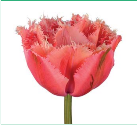
Tulipa 'Pink Magic'