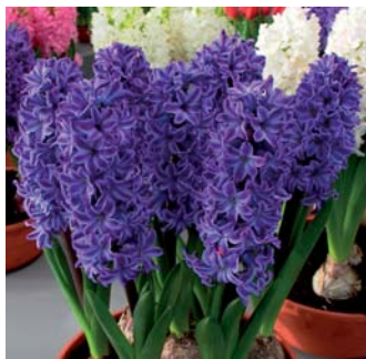
Hyacinthus orientalis 'Ugana'

De KAVB en/of BloembollenVisie zijn niet aansprakelijk voor schade voortvloeiend uit de registratie en/of publicatie van de desbetreffende cultivars.